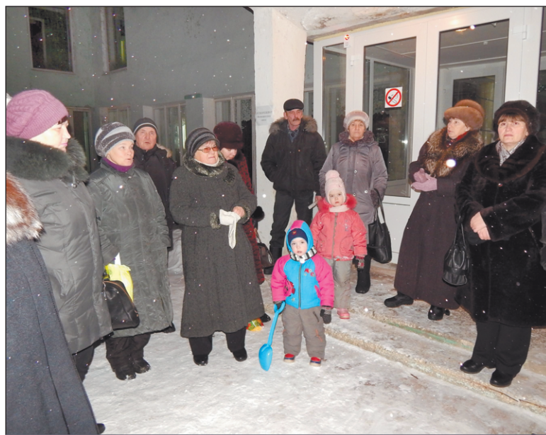
Старшие домов п. Восточного вынуждены были проводить собрание на улице

«Например, в списках работ по обслуживанию домов с шиферной крышей может быть предложена частичная замена рулонной крыши. А в домах с плоской крышей – очистка парапетов от снега и сосулек, но в выполнение работ включают всю площадь крыши. Замеры сопротивления и изоляции положено выполнять один