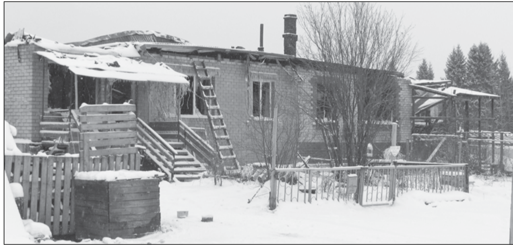
После пожара по ул. Майской в двухквартирном доме уцелели лишь стены, но жить в нём невозможно.