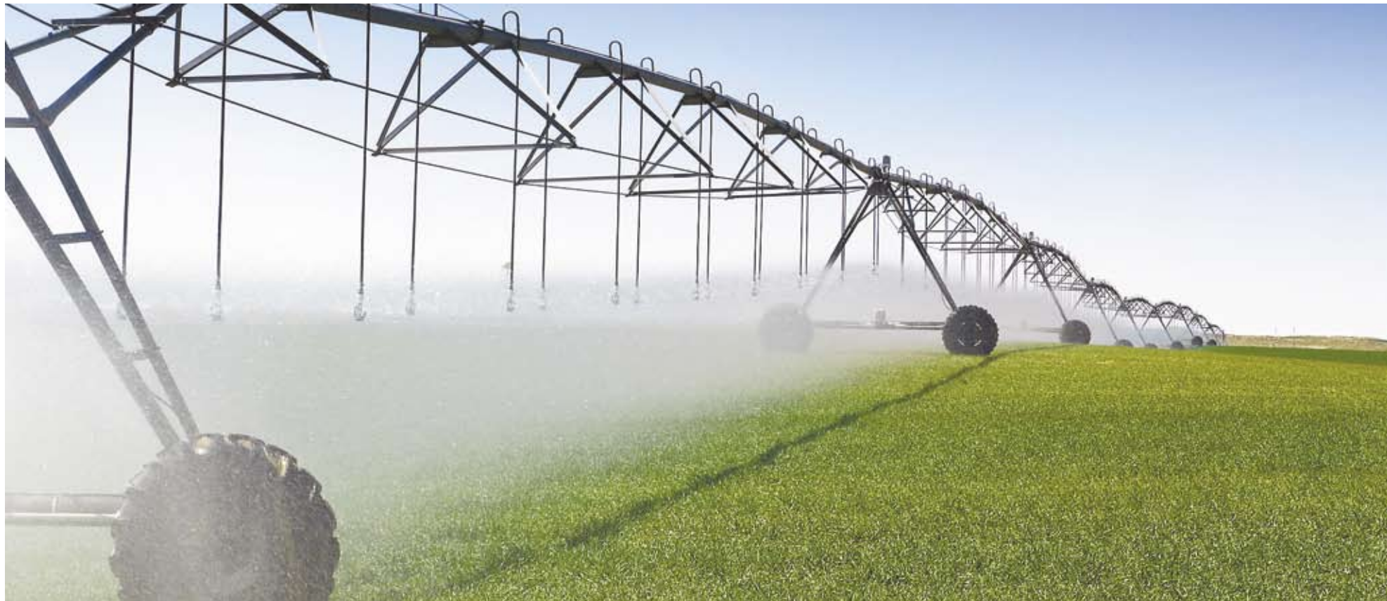
Оросительные системы «Бауэр» в Таганроге начнут выпускать позже. Или не начнут вовсе.

«БАУЭР ТАГАНРОГ», ДОЧЕРНЯЯ КОМПАНИЯ ОДНОГО ИЗ КРУПНЕЙШИХ В МИРЕ ПРОИЗВОДИТЕЛЕЙ ИРРИГАЦИОННЫХ СИСТЕМ АВСТРИЙСКОЙ BAUER GMBH, НЕОЖИДАННО ОТКАЗАЛАСЬ ОТ УЧАСТИЯ В КОНКУРСЕ НА ПРАВО АРЕНДЫ ЗЕМЕЛЬНОГО УЧАСТКА В ТАГАНРОГЕ, ПРЕДНАЗНАЧЕННОГО ДЛЯ СТРОИТЕЛЬСТВА ЕЕ ЗАВОДА. АВСТРИЙЦЫ ТРЕБУЮТ НАЗВАТЬ БУДУЩУЮ ЦЕНУ ВЫКУПА ЗЕМЛИ. В АДМИНИСТРАЦИИ ТАГАНРОГА УВЕРЯЮТ, ЧТО ЭТОГО СДЕЛАТЬ НЕ МОГУТ, И В СВОЮ ОЧЕРЕДЬ ТРЕБУЮТ ОТ «БАУЭР ТАГАНРОГ» ГАРАНТИЙ СТРОИТЕЛЬСТВА ЗАВОДА С ОБЪЕМОМ ИНВЕСТИЦИЙ БОЛЕЕ 900 МЛН РУБ.