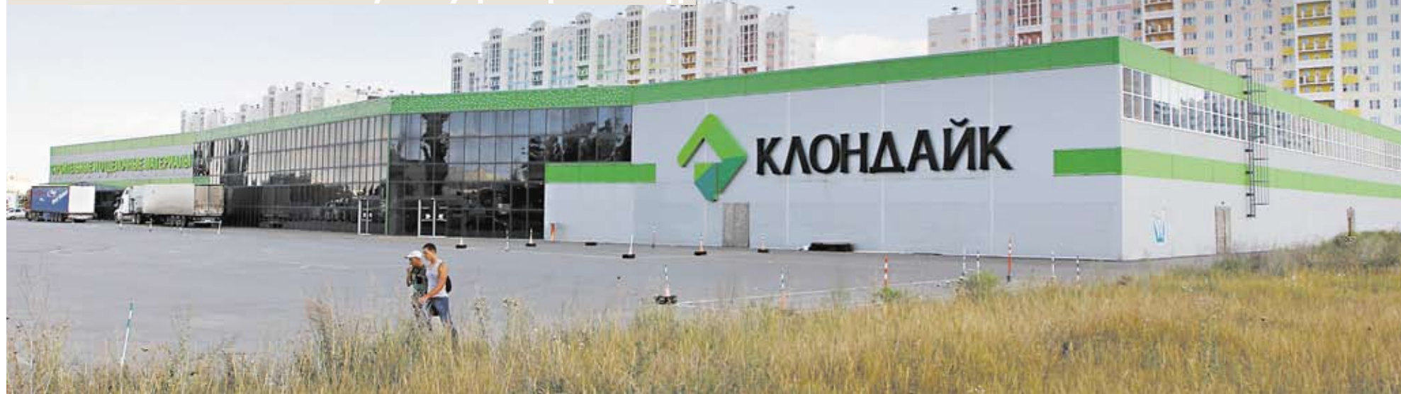
15 тыс. кв. м бывшего ТЦ «Клондайк» на ул. Доватора готовится занять гипермаркет «Лента».

Открытие «Ленты» на 15 тыс. кв. м по соседству с центром мелкооптовой торговли METRO Cash & Carry планируется до конца года, уже идет набор персонала. В METRO считают, что приход нового игрока не повлияет на их бизнес. С этим мнением соглашается представитель другой федеральной сети, указывая на то, что у немцев формат мелкого опта и ниши не будут сильно пересекаться. По мнению участника рынка, в Ростове уровень конкуренции среди крупных игроков ритейла достаточно высок, но возможности для развития еще есть.