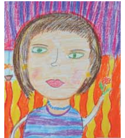
1 место, Максим Минаев, 8 лет.