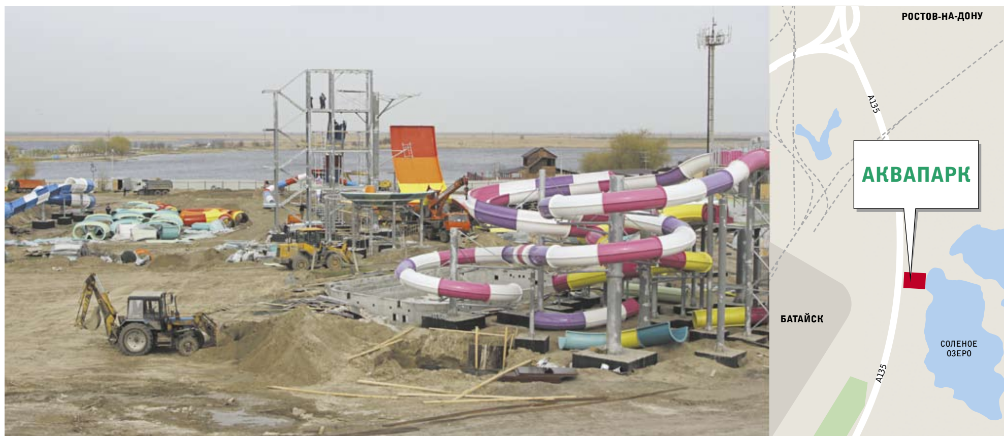
Аквапарк возле Соленого озера планируют достроить в июле этого года.

РОСТОВСКОЕ ООО «АКВАИНВЕСТПРОЕКТ» СТРОИТ В БАТАЙСКЕ ОКОЛО СОЛЕННОГО ОЗЕРА АКВАПАРК С ОДНОЙ ИЗ САМЫХ ВЫСОКИХ ГОРОК В РОССИИ