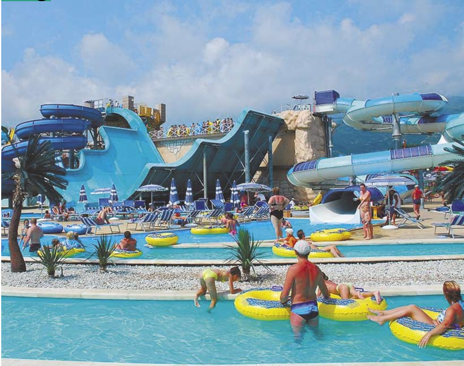
Самая высокая горка в России (25 метров) находится в аквапарке «Золотая бухта» в Геленджике (на фото). Под Батайском строят вторую по высоте в стране (16 м).