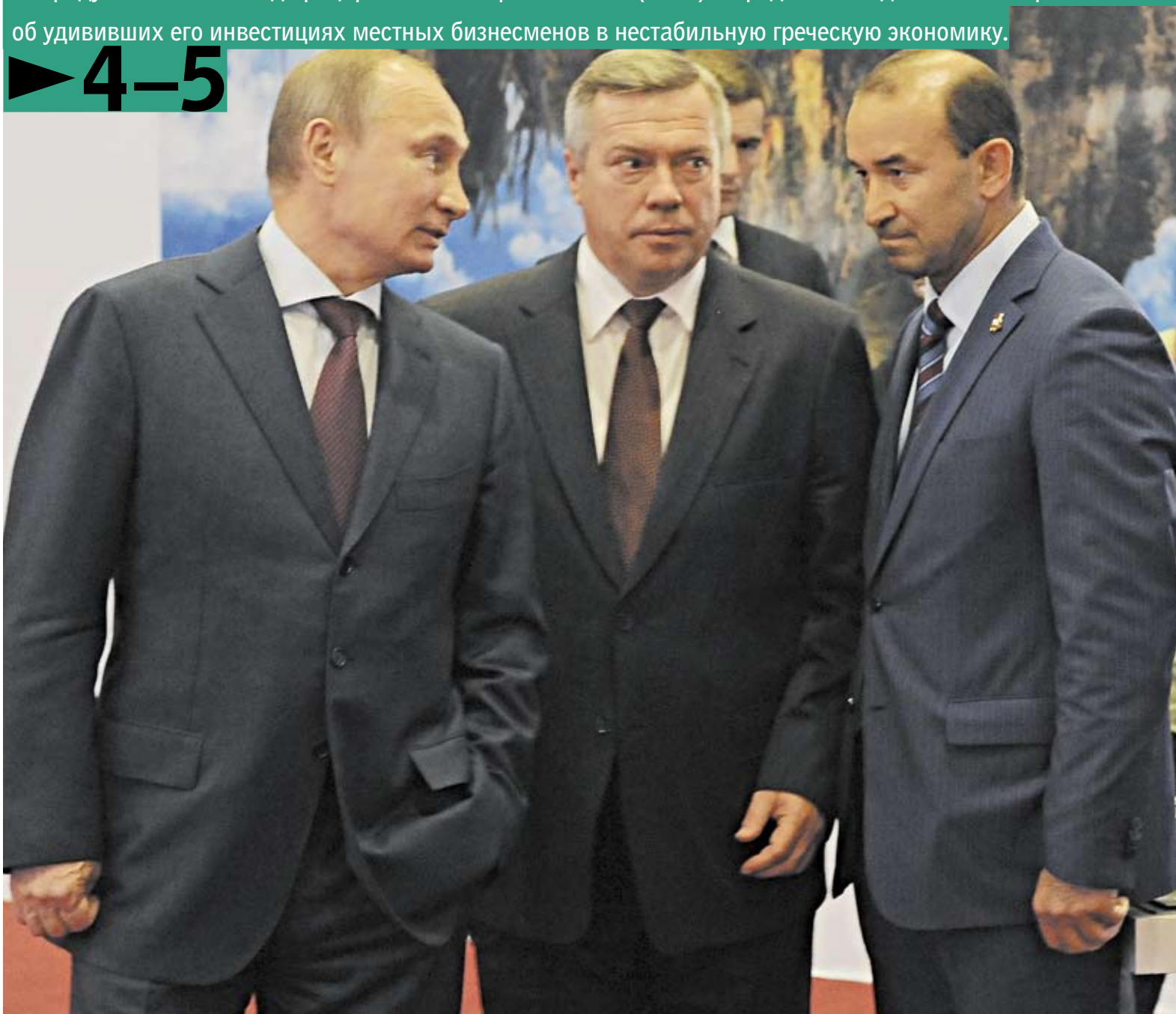
Просьбы гендиректора ГК «Евродон» ВАДИМА ВАНЕЕВА (справа) об увеличении срока субсидирования его «индюшиного» проекта и экспорта мяса птицы нашли понимание у президента ВЛАДИМИРА ПУТИНА и губернатора ВАСИЛИЯ ГОЛУБЕВА (в центре).