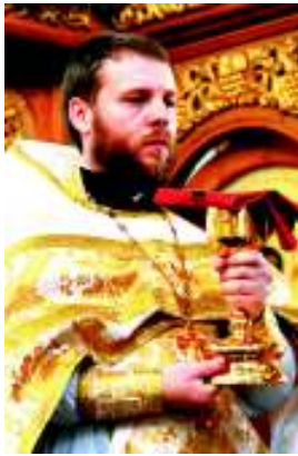
Несу послушание благочинного.

В интервью «Шахтинским известиям» он рассказал о своем пути к новому назначению и своих обязанностях. А также в канун православного праздника Крещения обратился к жителям города Шахты.