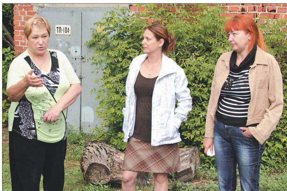
Жительницы поселка обеспокоены: когда дадут газ?

ного в Шахтах и занимающегося экскурсионным обслуживанием.