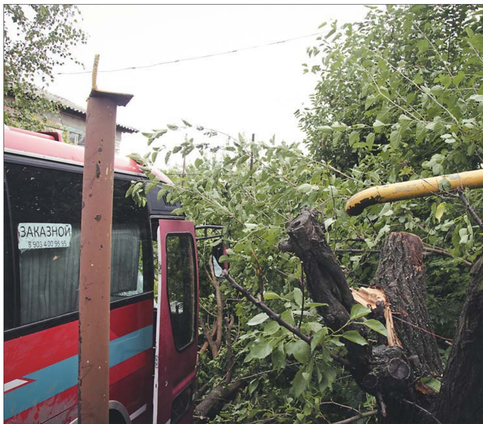
Автобус пропахал около пяти метров, по пути сбив деревья, газопровод и сетчатый забор.

О том, кто был за рулем автобуса и как произошла авария, мы спросили, позвонив по номеру телефона, указанному на транспортном средстве под словом «Заказной». Оказалось, что тот же номер указывается в контактных данных ООО «ДонТур», зарегистрирован-